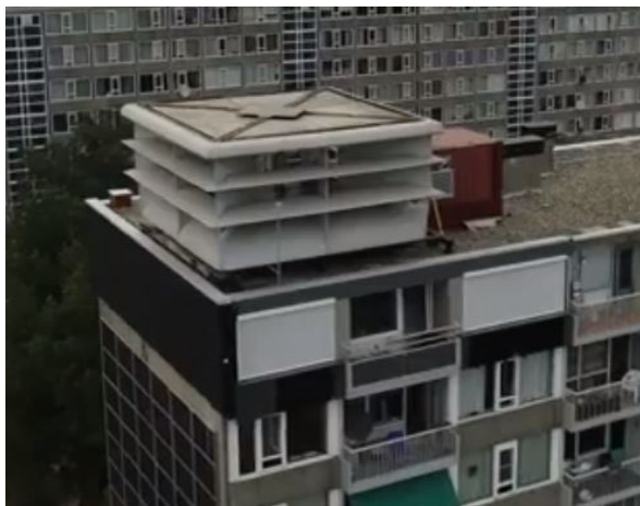
Afb 1: Aanzicht proefwoning (zuidzijde), nog voor plaatsing zonnepanelen in de borstwering van het balkon

In de maanden voorafgaand aan de realisatie is het systeem geëngineerd. De langs- en kopgeveldelen zijn prefab geproduceerd en voorzien van de in de gevel geïntegreerde installaties (zonnepanelen, ventilatie-units, isolatie, zonwering, hydrauliek en bekabeling). De bestaande gevel is verwijderd en vervangen door de nieuwe multifunctionele geveldelen. De elementen zijn aan binnen- en buitenzijde afgewerkt en op de bestaande woning aangesloten. Het energiesysteem is gekoppeld aan de collectieve installaties bedoeld voor in het kopgeveldeel. Op 10 hoog kon er echter geen afzonderlijk kopgeveldeel geplaatst worden; dit deel is daarom als 'klimaatcontainer' op het dak geplaatst.