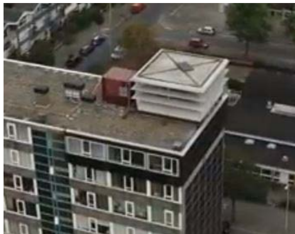
Afb 2: Aanzicht proefwoning (noordzijde) na plaatsing van de nieuwe geveldelen.

Vervolgens is het systeem in de bewoonde woning gedurende de periode juli-december 2018 gemonitord, waarbij er gaandeweg nog enkele aanpassingen zijn doorgevoerd (o.a. verlate plaatsing van zonnepanelen in het balkon van de flat). De bewoonster zat daarbij in de driver's seat: zij kon de energieprestaties op haar eigen energiemeter volgen en eventuele klachten direct doorgeven. In januari 2019 zijn aanvullende geluids- en luchtdichtheidsmetingen uitgevoerd in de woning.